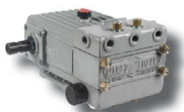
Bomba especial directa ML-D Bomba especialmente diseñada para atomizadores