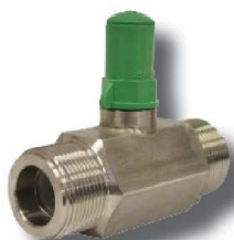
Caudalímetro inoxidable (Solo para sistromatic)